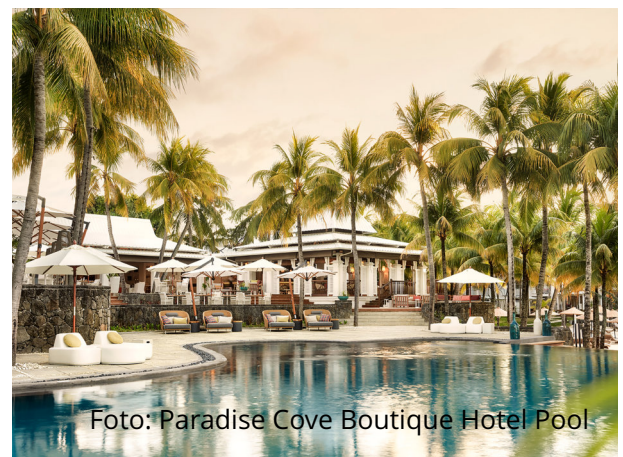
Foto: Paradise Cove Boutique Hotel Pool