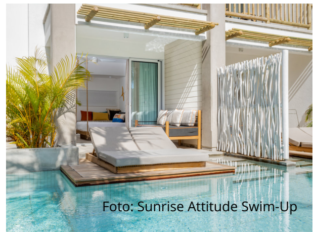
Foto: Sunrise Attitude Swim-Up